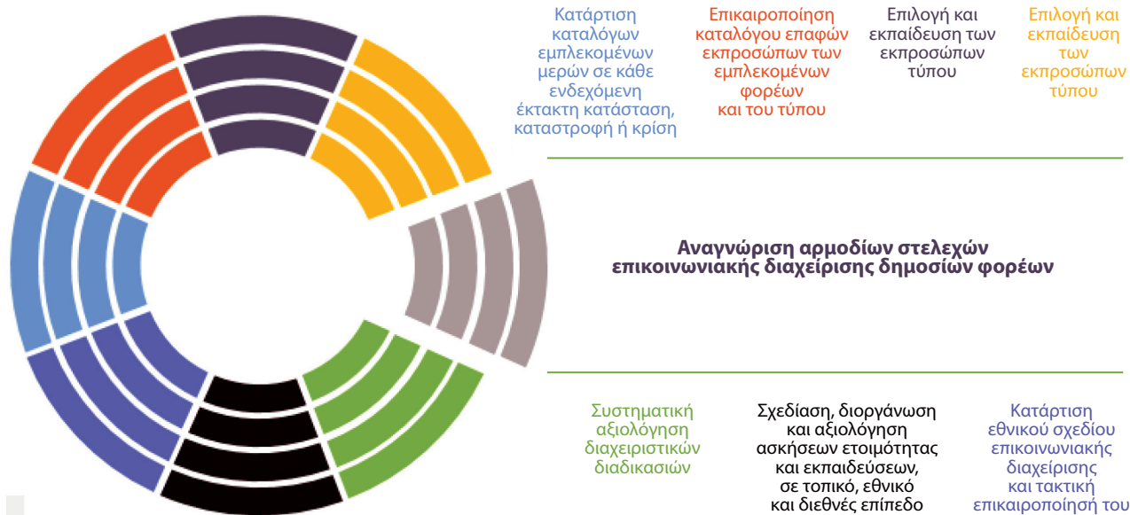
Εικόνα 1. Αρμοδιότητες ομάδας επιχειρησιακής ετοιμότητας.

Στο πλαίσιο άσκησης των αρμοδιοτήτων τους, τα στελέχη του ΕΚΕΠΥ προχώρησαν στην εκπόνηση του σχεδίου