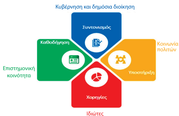
Εικόνα 2. Η πολυτομεακή διάσταση της εθνικής στρατηγικής.

Σύμφωνα με συστάσεις του CDC και του ΠΟΥ, πρωταρχικό μέλημα σε κάθε τέτοιο εγχείρημα συνιστά η επιλογή των στελεχών με αρμοδιότητες επιχειρησιακής ετοιμότητας