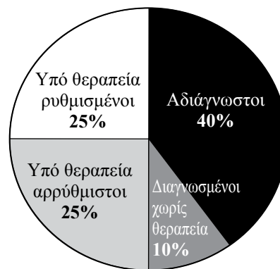
Εικόνα 1. Ποσοστά διάγνωσης, θεραπείας και ρύθμισης της υπέρτασης σε μελέτες στην Ελλάδα.

Η υπέρταση είναι εξίσου συχνή στη χώρα μας όσο και σε άλλες αναπτυγμένες χώρες και αφορά περίπου στο 25% του πληθυσμού των ενηλίκων. Τα ποσοστά διάγνωσης, θεραπείας και ρύθμισης της υπέρτασης στη χώρα μας (εικ. 1) είναι παρόμοια με αντίστοιχα ερευνών σε πληθυσμούς άλλων αναπτυγμένων χωρών. Πολλοί αγνοούν ότι έχουν αυξημένη πίεση, αλλά και από αυτούς που το γνωρίζουν λίγοι επιτυγχάνουν ικανοποιητική ρύθμιση. Το ποσοστό καλής ρύθμισης, τόσο στην Ελλάδα όσο και το εξωτερικό συνήθως δεν υπερβαίνει το 25% του συνόλου των υπερτασικών. Άρα, και στη χώρα μας υπάρχουν μεγάλα περιθώρια τόσο για τη μείωση των περιπτώσεων αδιάγνωστων υπερτασικών, όσο και για την αποτελεσματικότερη